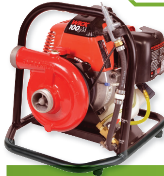
Modèle de carburant à distance